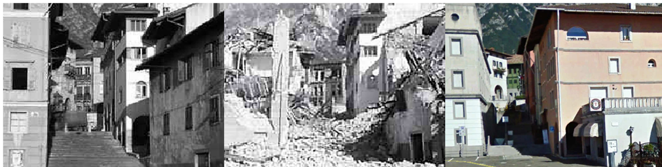
Figura 1. Gradinata del mercato a Gemona del Friuli: prima del 1976 (1), dopo il 1976 (2), com'è oggi (3).