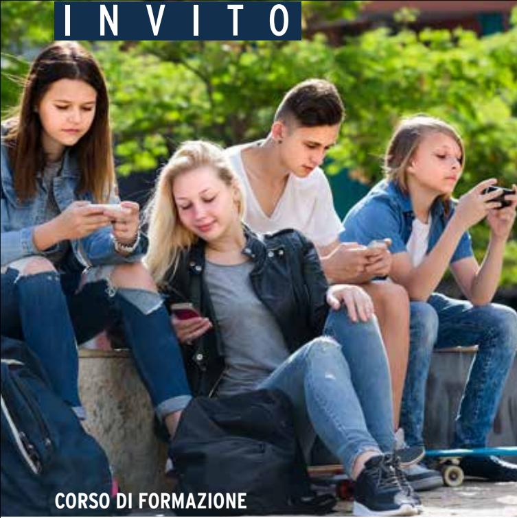
CORSO DI FORMAZIONE